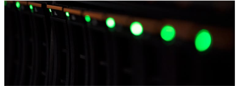
Der Hacker zielt auf die IT-Infrastruktur.