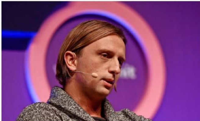
Revolut-Chef Nikolay Storonsky.

Plötzlich meldete das Smartphone laufend neue Abbuchungen – innert Minuten waren Zehntausende Franken weg. Die Handy-Bank versichert dennoch, es gebe keine Sicherheitslücken.